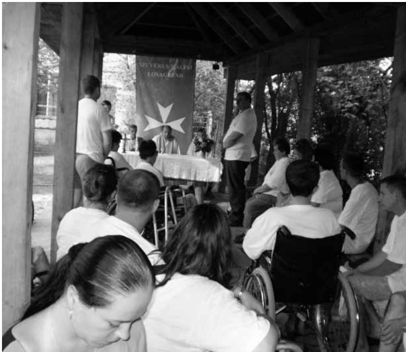
Szentmise a Kárpátaljai (Borzsova) táborban

asszony segítségével betekintést nyerhetek a diplomácia és konzulátusi munka rejtelmeibe. Esténként éjszakába nyúló programokkal igyekeztek a szervezők a fiatalok kedvében járni: a hagyományos tábortűzön kívül volt kareoke-show, táncház, és szombat este vendég volt a Hajnal Csillag zenekar, akik fantasztikus hangulatot varázsoltak a Borzsaparti táborba. A záró szentmisét Michels Antal atya celebrálta, amely után minden résztvevő a versenyekben elért eredményeiért oklevélben és apróbb ajándékokban részesült. Az egyik legmeghatóbb jelenet az volt, amikor az egyik mozgássérült fiatal és édesanyja szót kért, és elénekelték a tábor számára általuk írt dalt, amit mindenki jó szívvel és örömmel titulált a tábor záróhimnuszának.