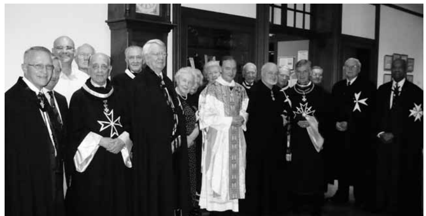
A június 24-i Szent János napi-ünnepség Washingtonban

Július 29-én a budai Várban, a Magyar Kultúra Alapítvány székházában a bor-