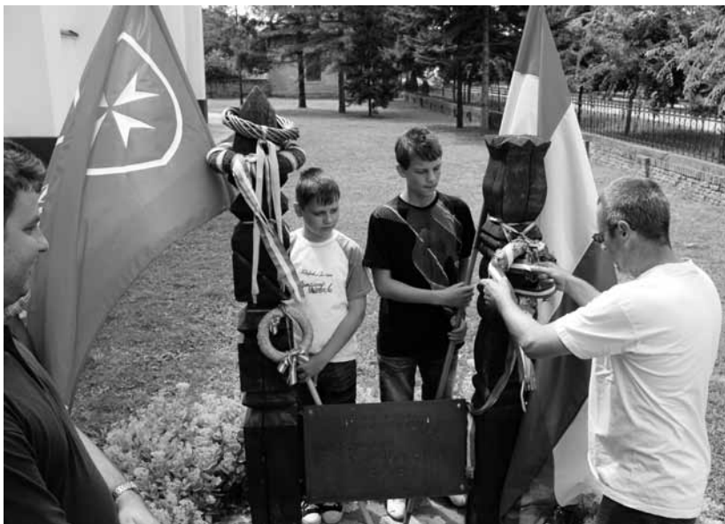
A kopjafánál az „Összetartozunk” táborban

múltunkat, közben gyakorolhassák anyanyelvüket, barátságokat köthessenek. Tapasztalják meg, hogy lakóhelyüktől távol is élnek magyarok.