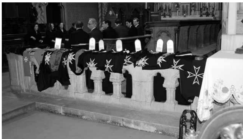
Avatások június 24-én a Mátyás-templomban