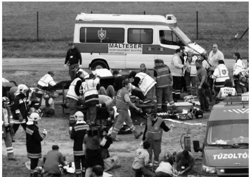
Katasztrófavédelmi gyakorlat Sukorón

lat során a tömeges balesetek felszámolását sajátítják el a résztvevők. Sajnos a közelmúltban több alkalommal fordult elő ilyen esemény, amikor a sérülteken csak több szervezet összehangolt munkájával lehetett eredményesen segíteni. Az idei „baleset” megrendezésében és a műszaki mentésben a Székesfehérvári Tűzoltóság volt segítségünkre.