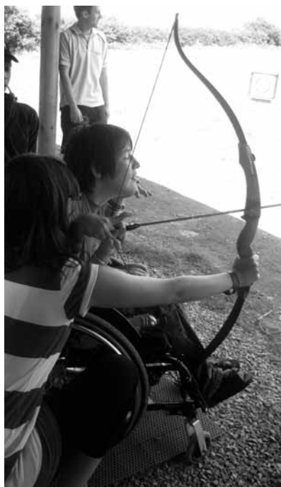
Íjazás Angliában a Máltacamp táborban

Szállásunk a Bluestone Nemzeti Parkban terült el, s az üde, zöld, csendes