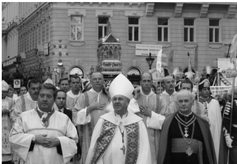
Az augusztus 20-i Szent Jobb körmenet

Augusztus 20-tól a Spar hálózat valamennyi üzletében kapható a Magyar Máltai Szeretetszolgálat 200 forintért megvásárolható árvízkártája. A Spar, Interspar és Kaiser's üzletek pénztárainál megtalálható kártya vásárlói az árvízkárosult családok életének újrakezdéséhez járulnak hozzá.