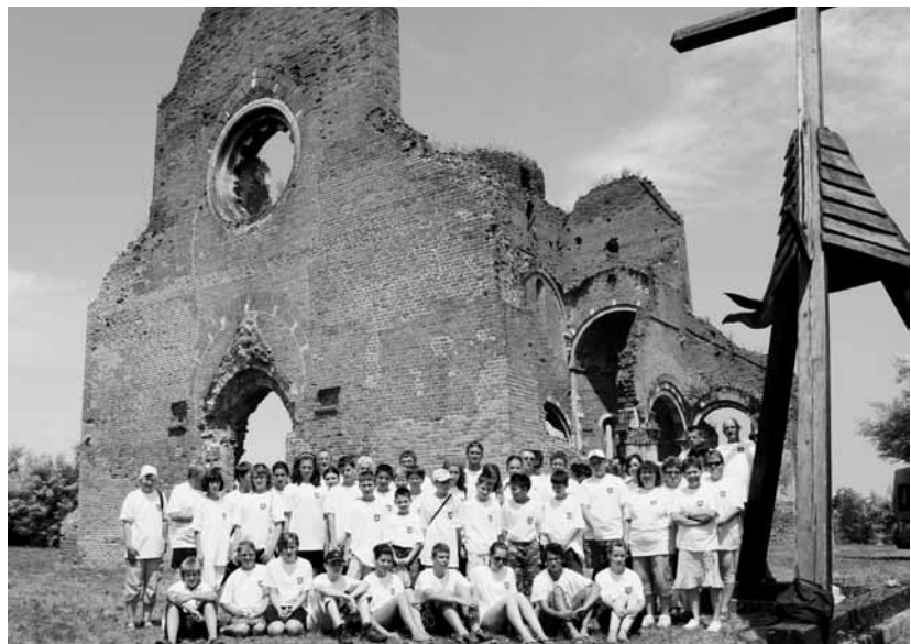
Csoportkép az „Összetartozunk” tábor résztvevőiről