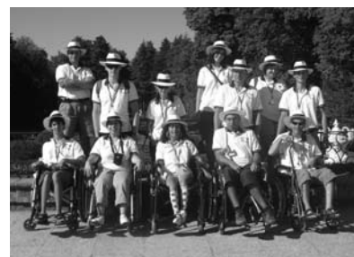
A Maltacamp 2009 magyar résztvevői

A 2010-es táborra Angliában, a Bluestone parkban kerül majd sor, július 10-től 17-ig.