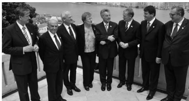
A Nagymester budapesti látogatása állam- és kormányfők társaságában