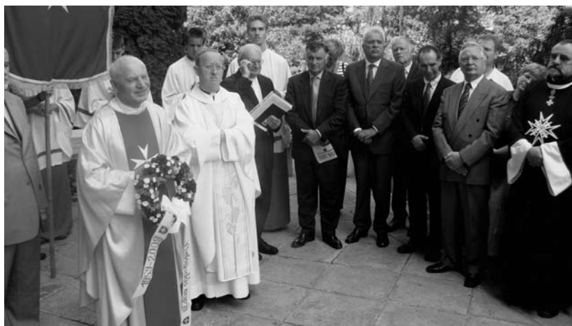
A zugligeti Szent Család-plébániatemplom falára helyezett emléktábla koszorúzása

Délután a „Magyarországnak van a legnagyobb szíve” programunk lezárásaként az eddig összegyűjtött több tízezer szívből jelenítettük meg Magyarország nagy szívét a Szent István-bazilika előtti téren. Ezzel a képpel kívántuk 20 éves tapasztalatunkat üzenetként megfogalmazni: a nehéz helyzetekben a magyarok szíve mindig kész a segítségre.