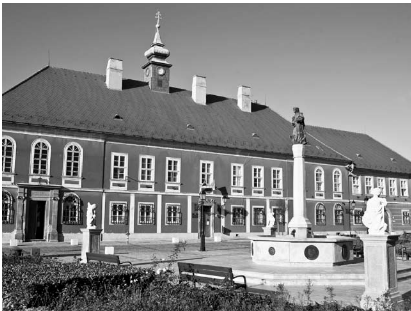
Az MMSz által működtetett váci kórház

A program fő feladata a hajléktalan személyek, mint a leginkább veszélyeztetett társadalmi csoport félévenkénti szűrése, de a szolgáltatás rugalmassága miatt