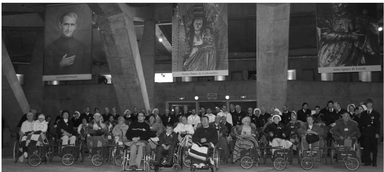
A magyar zarándokok a föld alatti templomban, a Csíksomlyói Szüz Mária képe alatt