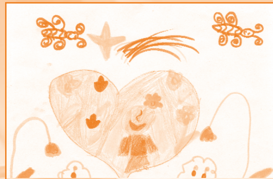
Szabó Lili, 8 éves