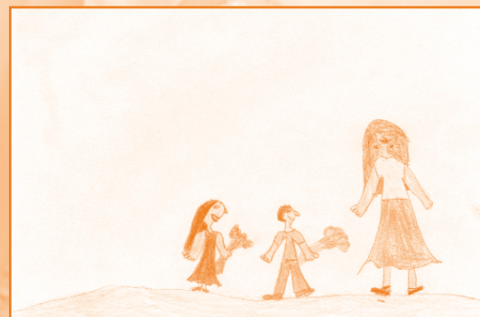
Kalmár Réka, 7 és fél éves