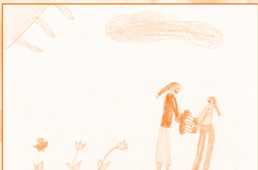
Sebestyén Réka, 7 és fél éves

Édesanyám, virágosat álmodtam, napraforgó- virág voltam álomban, édesanyám, te meg fényes nap voltál, napkeltétől napnyugtáig ragyogtál.