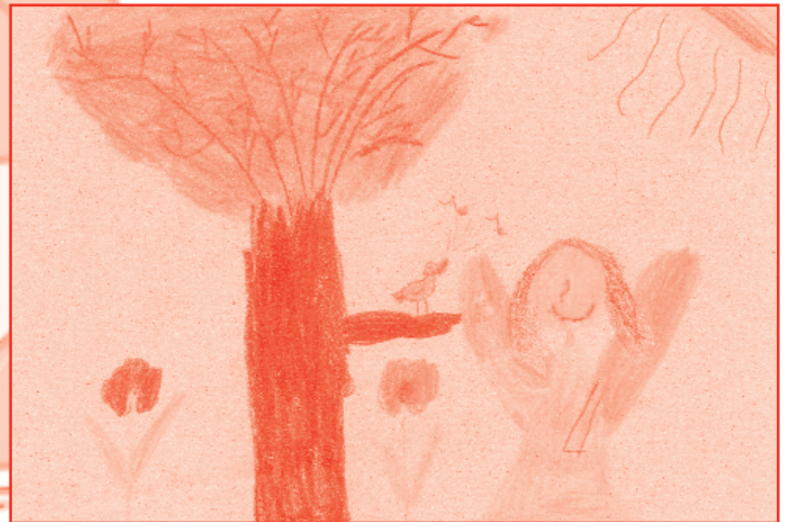
Bereczle Viki, 7 és fél éves

De ha végre mosolyog, minden csillag felragyog, ünnepel az ég és föld, színük azúrkék és zöld.