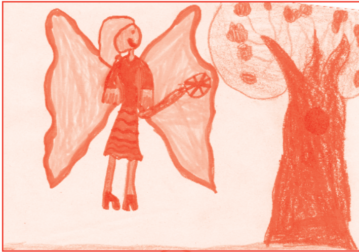
Sebestyén Réka, 7 és fél éves