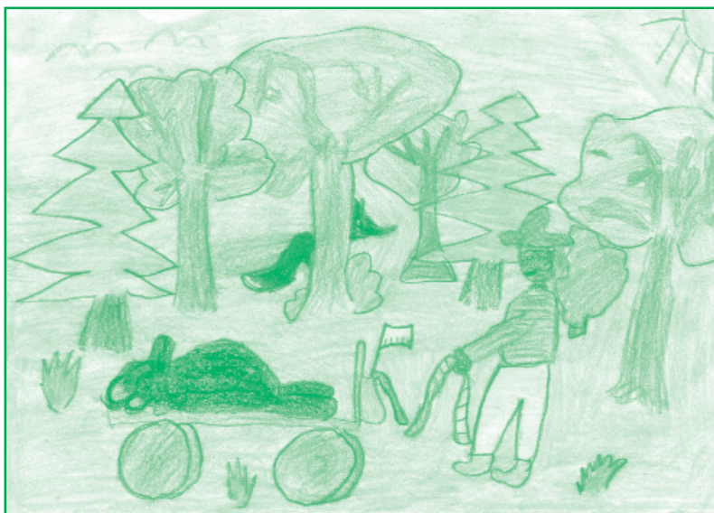
Illusztrálta: Marton Bea

- Huhh! - hördült fel a róka, és ugrott egyet. - Bizony igaz az a régi mondás, hogy jótett helyébe jót ne várj, és azt mondom, még az is igaz, hogy nincs rosszabb ellenség a barátnál... - és lóhalálában menekült a kutyák elöl.