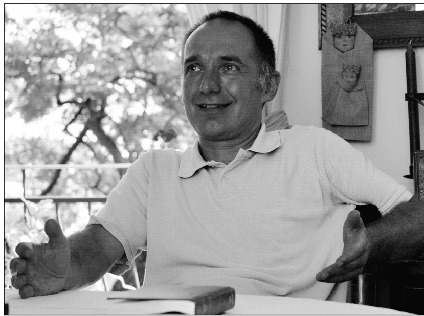
„Mintha azt gondolnánk: megnyomunk egy gombot, és attól meg fog változni a társadalom”

– Érdemes visszatekinteni az elmúlt másfél évben lejátszódott folyamatra. Az egész társadalom őszintén aggódott, hogy „bedől a bankrendszer”. Nem egészen értettük, mi az a bankrendszer meg a konszolidáció, de azt igen, hogy vannak köteleességek, segíteni kell a bankokon, hiszen a mi pénzünk is náluk van. A másik izgalmat a na-