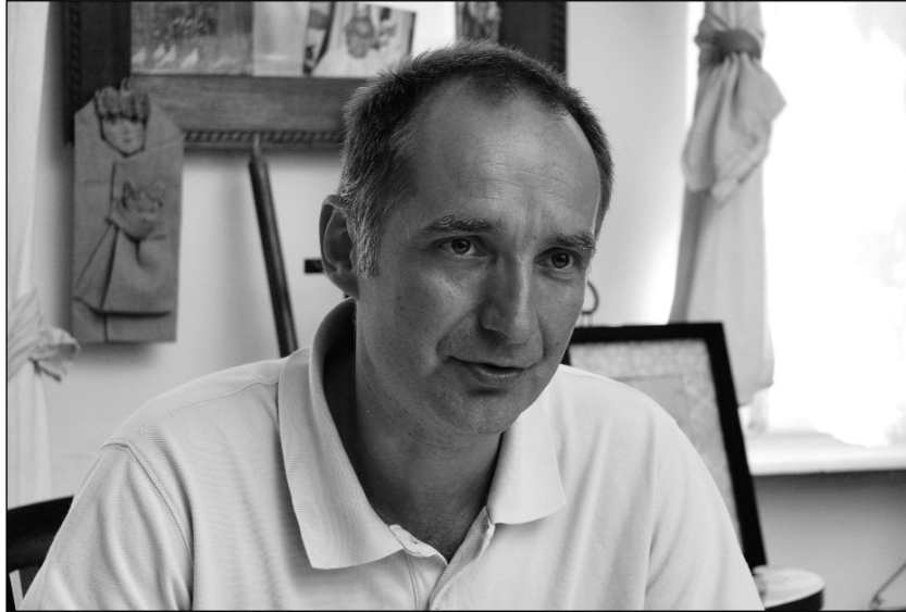
„Iszonyú keveset hallunk arról, hogy milyen válságfolyamatok játszódnak le a családokban...”

belenőttek: az uzsorának, különböző érdekcsoportoknak. Ha valaki azt gondolja, hogy az ilyen helyre juttatott támogatások a közösség ja-