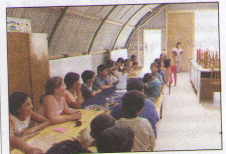
Gyöngyfüzés a tabáni gyerekeknek

a telepen dolgozik, és az ottani családokat a szociális munka eszköztárával segíti. A program második lépcsője a lakhatási integráció, amely a putrik és az illegálisan épült kunyhók felszámolását szolgálja. Mint Kiss Dávid fogalmazott: „Akik a személyes életvitelükkel bebizonyították, méltók arra, hogy a szeretetszolgálat közreműködésével elfogadható színvonalú lakásokba költözzenek, azok számára minden segítséget megadunk. Ily módon 10-12 család költözött el a telepről”. A program harmadik lépcsőfoka a gyermekekre fókuszál. Ennek keretében a szeretetszolgálat 2005-ben közösségi fog-