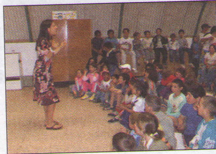
Énekes mesemondó délután a hangárban