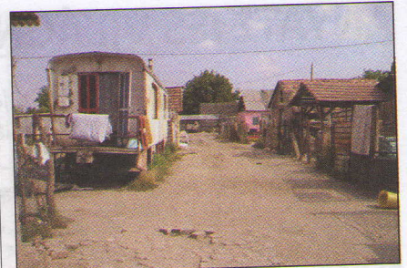
Lakókocsi és egyéb építmények