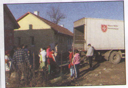
Költözés a szeretetszolgálat segítségével